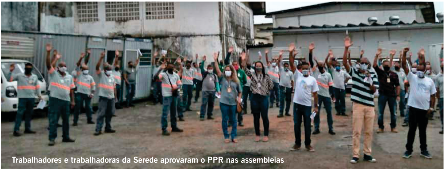
Trabalhadores e trabalhadoras da Serede aprovaram o PPR nas assembleias

Os trabalhadores e as trabalhadoras da Serede, da capital e do interior, aprovaram a proposta discutida entre a empresa e o Sindicato para fechamento do Programa de Participação nos Resultados – PPR exercício 2020 nas assembleias realizadas no mês de setembro. A maioria da categoria votou à favor da proposta, sendo registrado apenas um voto de abstenção.